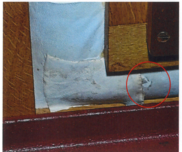
naast de reeds eerder gedane reparatie is het loslaten van de toplaag goed te zien

De werking van de regelkleppen die zich in de balg bevinden wordt beoordeeld en zonodig hersteld. Daarnaast wordt de motor gesmeerd en de windregelaar (rolgordijn) nagezien.