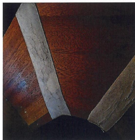
de huidige leerbanden zijn dermate uitgedroogd dat lekkage dreigt

Het leer van de voorslagen is nog in prima conditie. Dit wordt indien nodig opgewerkt om een betere afdichting te verkrijgen. In incidentele gevallen wordt het leer vervangen.