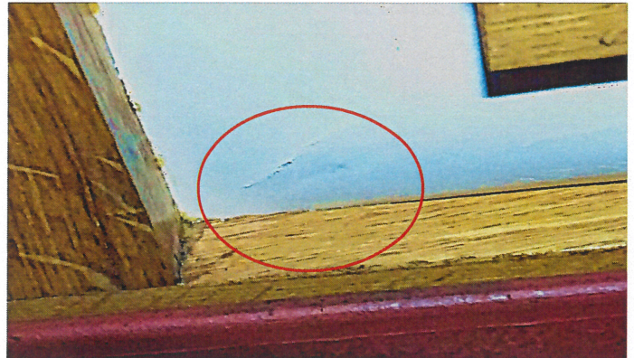
scheurvorming in de hoeken

Het leer van de zwembalgen is aan het einde van haar levensduur. De eerste tekenen van potentieel uitscheuren van het leer zijn inmiddels zichtbaar. Wij durven in ieder geval te stellen dat het leer het niet zal houden tot aan een volgend groot onderhoud. Voor het vervangen van het leer van deze balgen, dienen alle mechanieken, ventielen en windkanalen losgekoppeld te worden.