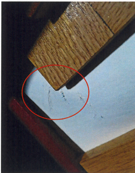
scheurvorming in de hoeken

Vervolgens worden de laden op hun kant gezet voor herstel van de balgen. Nadat de balgen opnieuw beleerd zijn, worden deze teruggeplaatst. Vervolgens worden de mechanieken opnieuw bevestigd en afgeregeld.