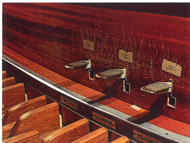
Rondom de klavieren zijn de gebruikssporen duidelijk zichtbaar

De orgelkas is vervaardigd van mahonie. Deze wordt in zijn geheel stofvrij gemaakt, zowel in- als uitwendig. De kas verkeert in technisch goede staat. Rondom de klavieren, het knieschot en bij kasdelen van het pedaalklavier is sprake van beschadigingen, schroef- en boorgaten en stickerresten. Dit zijn gebruikssporen na intensief gebruik van het orgel gedurende bijna 60 jaar. Wij realiseren ons dat het opknappen van de klaviatuur en haar omgeving een serieuze kostenpost is. Het betreft hier wel de werkplek van de organist en het visitekaartje van het orgel. Als deze werkplek een fraaie uitstraling heeft, werkt dat vaak uitnodigend en stimulerend voor een organist. Omwille van de kosten willen we u twee mogelijkheden bieden: